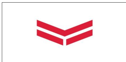
クルーザークラス