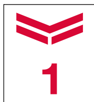
クルーザークラス